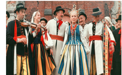
Chłopi w reż. Jana Rybkowskiego, 1973