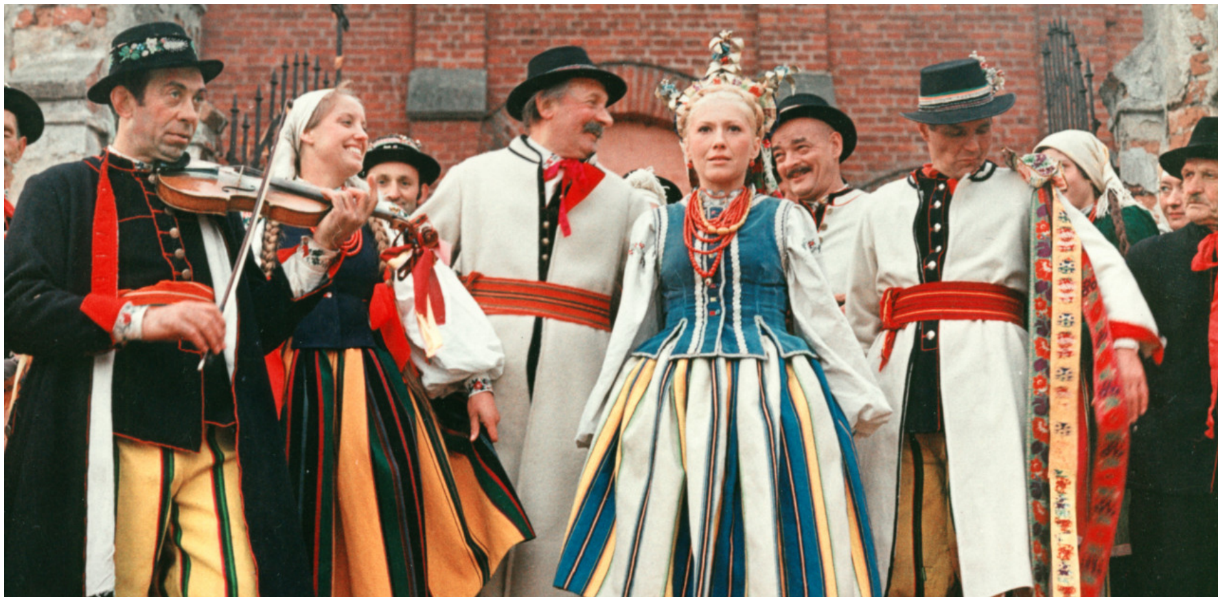
Chłopi w reż. Jana Rybkowskiego, 1973, 6.03.2023