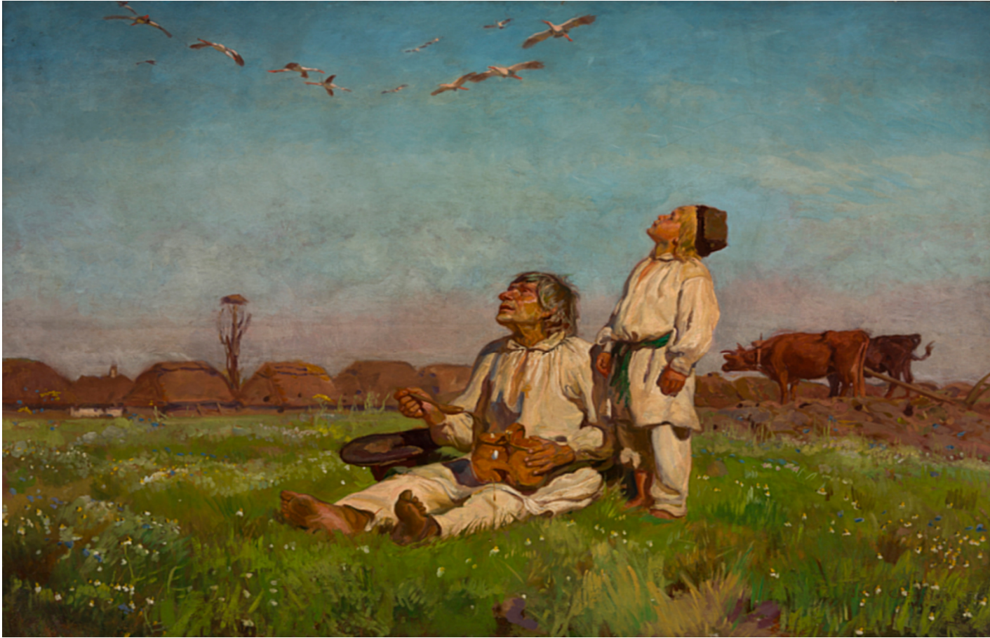
• „Bociany” Józef Chelmoński (1848-1914)