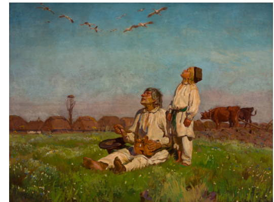
J. Chelmoński, Bociany , 1909, https://cyfrowe.mnw.art.pl/en/catalog/510861 , 6.03.2023 r.