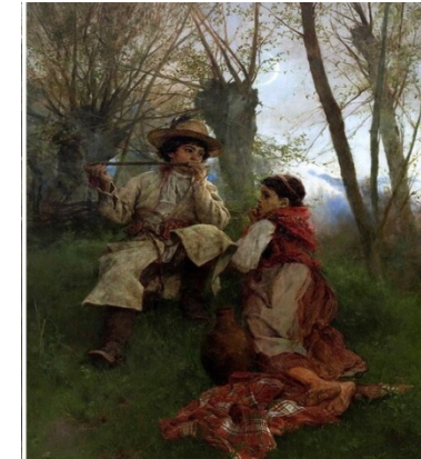
Witold Pruszkowski, Sielanka .

Anche la letteratura dell'epoca mostrava immagini realistiche della campagna - la fatica dei contadini e la crudeltà della nobiltà (S. Szymonowic, Żeńcy ); si lamentano della lunga giornata lavorativa, della durezza del malvagio Starosta e dell'Economo. Credono che tutto ciò sia iscritto nella condizione dei contadini.