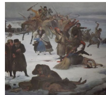
„Rabacja chłopska 1846”, Jan Lorenowicz, fot. Pesell/CC BY-SA 4.0.

1846 - Ribellione della Galizia - i contadini attaccano le case padronali e organizzano pogrom contro la nobiltà (Jakub Szela) a seguito della propaganda degli invasori - echi della ribellione della Galizia in Wesele (S. Wyspiański).