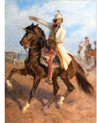
Kościuszko pod Raclawicami, J. Styka, link: https://platforma.historiadlapolonii.pl/leasons/hzd/69/8 ; 6.02.2023 r.

Rivolta di Kościuszko (1794), partecipazione dei contadini (soldati di Kosciuszko) alla battaglia di Raclawice e Połaniec (viene concessa loro la libertà personale, l'abolizione del potere giudiziario del signore sui contadini, la riduzione della servitù della gleba - non accettata dalla nobiltà). Kościuszko in abiti contadini in segno di riconoscenza.