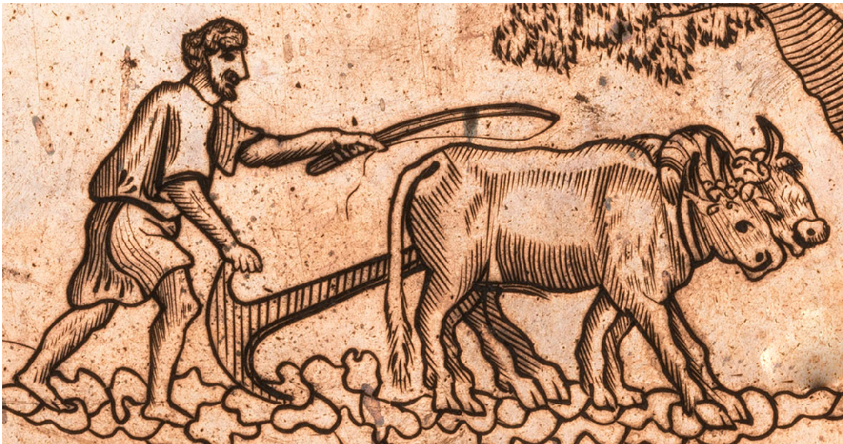
Chłopi przy pracy ( ryc. z XVIII elementarza), link: https://wielkahistoria.pl/zwyczajny-dzien-z-zycia-chlopa-panszczyznianego-jak-naprawde-wygladala-praca-na-polskim-folwarku/ 6.03.2023 r.