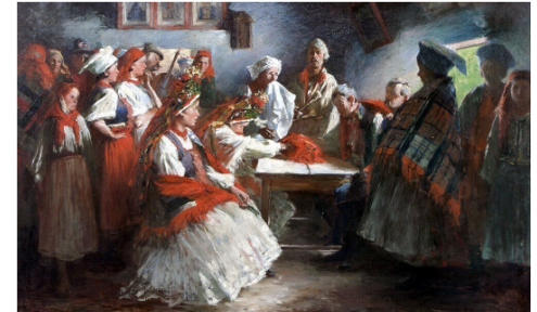
Włodzimierz Tetmajer, Zrękowiny , 1895 domena publiczna, 6.03.2023 r.

Wesele : l'intelligenza guarda la campagna in modo superficiale - vede rituali colorati, tradizioni, folklore, ma non vede la campagna reale. Fraternizzare con il popolo e contrarre matrimoni misti è stato miope. Questo è il risultato di una percezione idilliaca della campagna e di un'immagine idealizzata dei contadini.