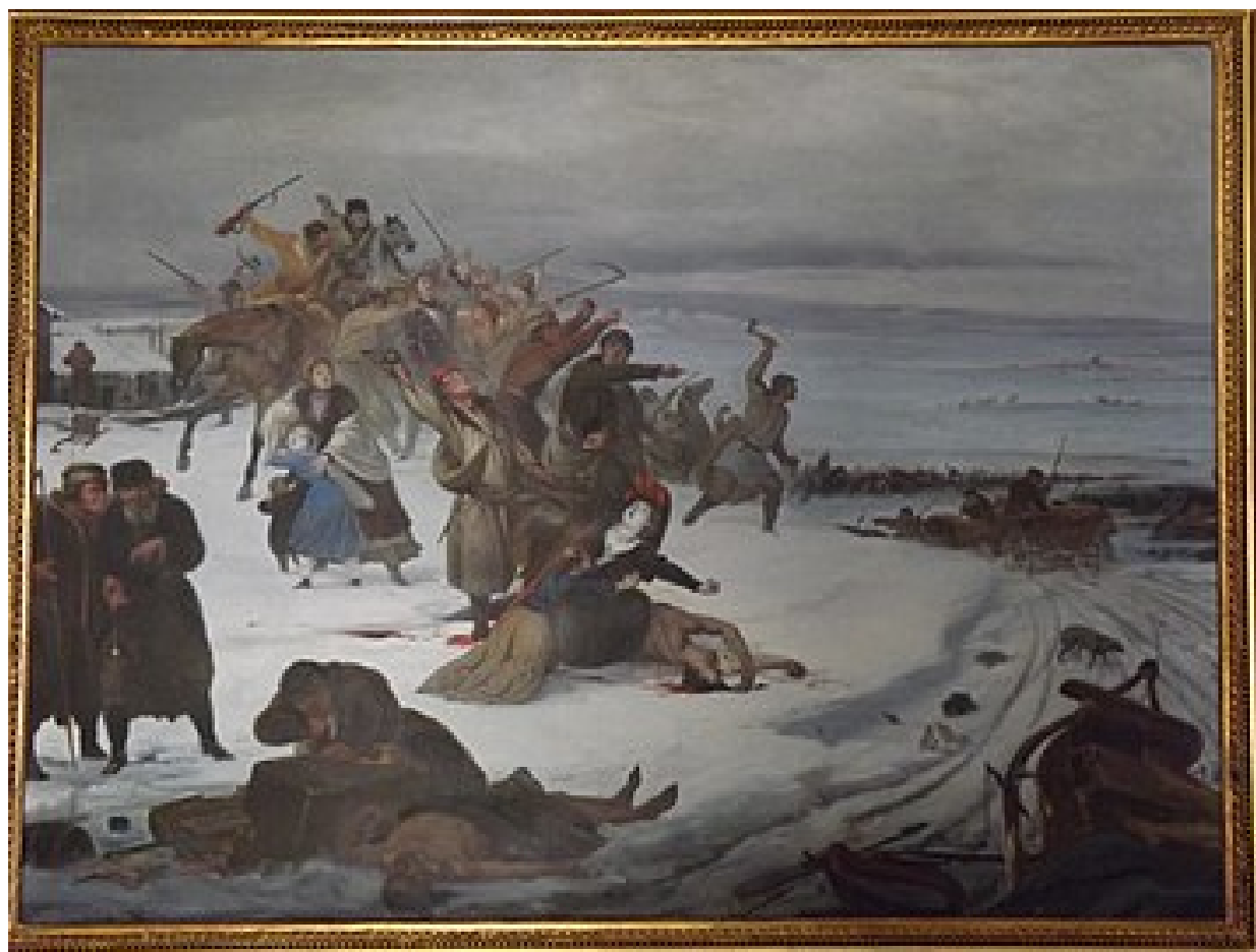
Rzeź galicyjska 1846. Jan Lorenowicz. Muzeum w Dołędze.